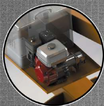
MOTOR GASOLINA 4T 7 HP PARTIDA ELÉTRICA