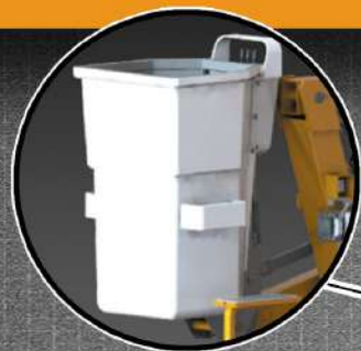
LINER DE ISOLAMENTO ATÉ 1000V

PRIMEIRA PLATAFORMA ELEVATÓRIA/CESTO AÉREO REBOCÁVEL HOMOLOGADO PELO DENATRAM NO BRASIL